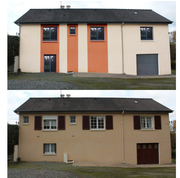
Exemple de photos à joindre