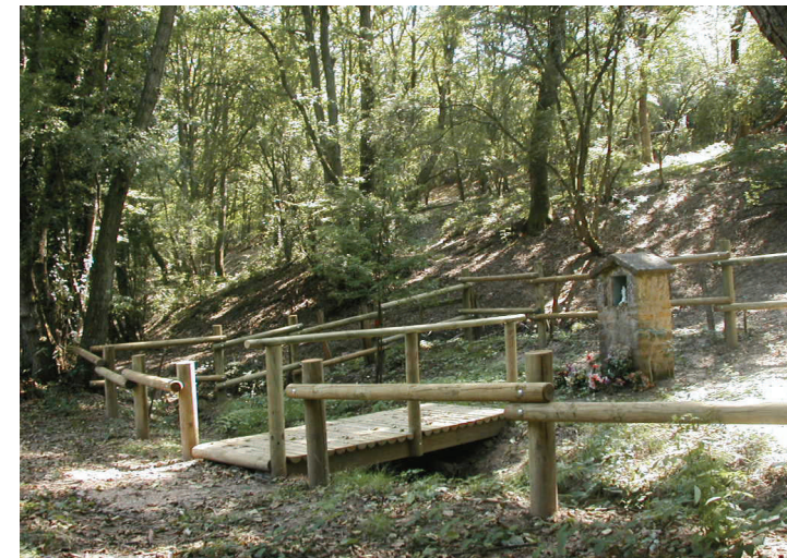
L'oratoire de Chantemerle (commune de Dardilly)

Depuis le bourg de Dardilly, partez sur les traces de Saint Jean-Marie Vianney, devenu au XIX ème siècle curé d'Ars. Isolé au fond du vallon de Chantemerle, un petit oratoire invite les pèlerins au calme et à la méditation.