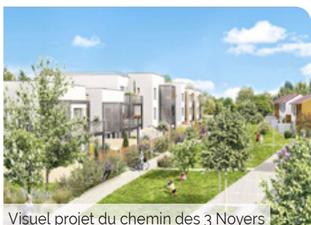
Visuel projet du chemin des 3 Noyers