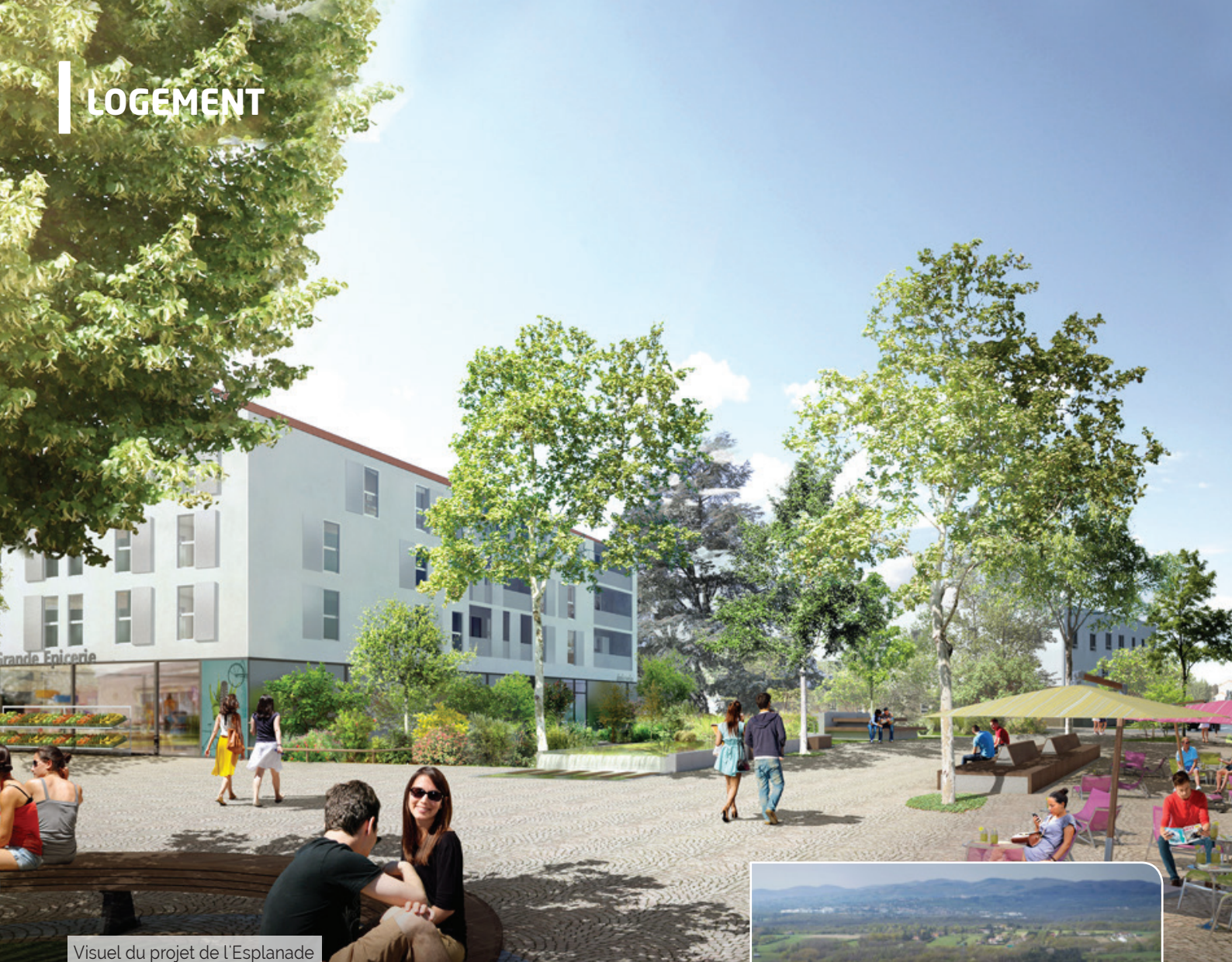
Visuel du projet de l'Esplanade