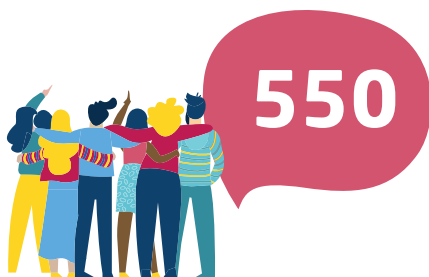
Personnes réunies au repas festif de la Fête de l'amitié, le 23 juin, sur la place de l'Eglise.