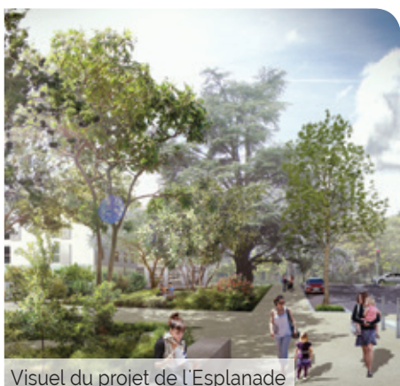
Visuel du projet de l'Esplanade