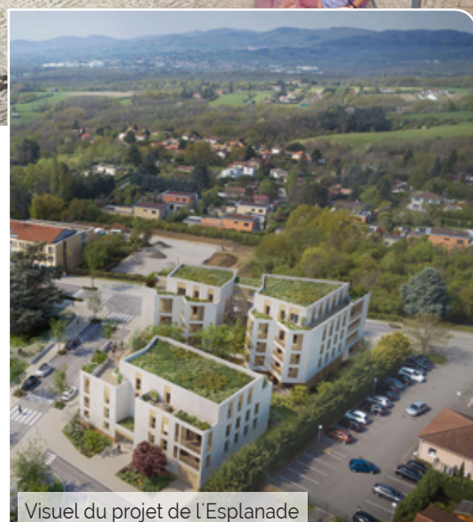
Visuel du projet de l'Esplanade

Le tout à l'abri des voitures. Un nouvel art de vivre au cœur de Dardilly.