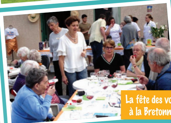
La fête des voisins à la Bretonnière

quinzaine DU DÉVELOPPEMENT durable 25 MAI - 8 JUIN