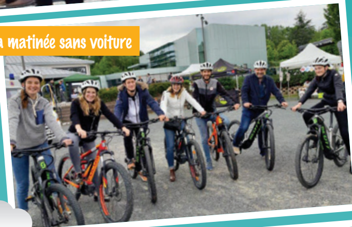
La matinée sans voiture