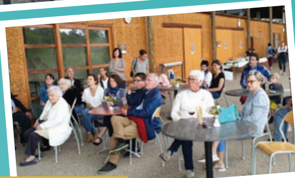
Sur un air gourmand