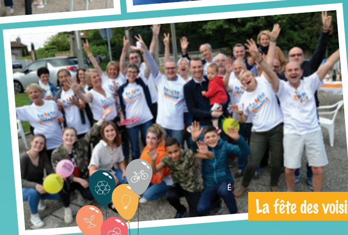
La fête des voisins

quinzaine DU DÉVELOPPEMENT durable 25 MAI - 8 JUIN