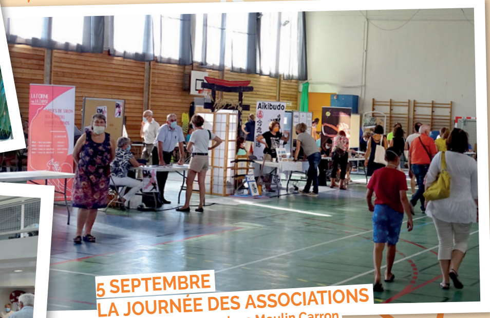
5 SEPTEMBRE LA JOURNÉE DES ASSOCIATIONS à L'Aqueduc, au complexe Moulin Carron et à l'école de musique