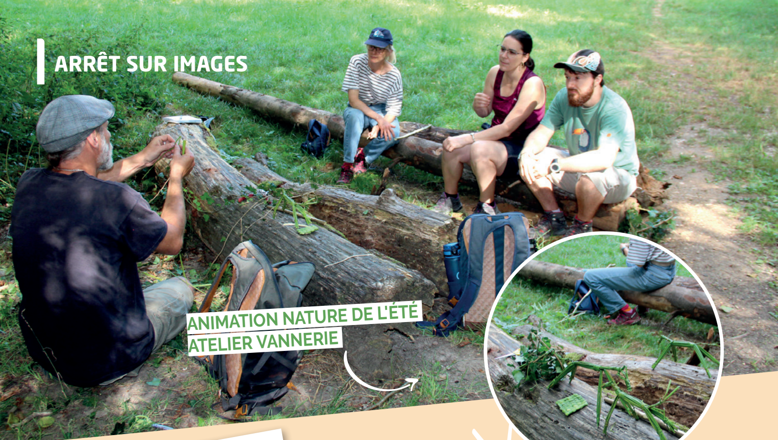
ANIMATION NATURE DE L'ÉTÉ ATELIER VANNERIE