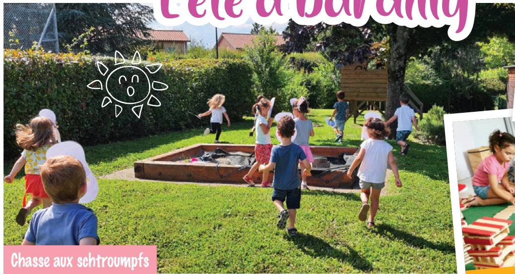
Chasse aux schtroumpfs