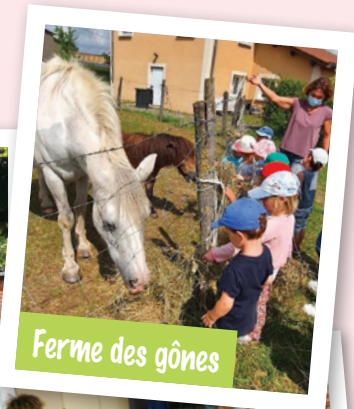
Ferme des gônes