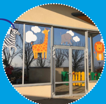
DÉCORATION DES FAÇADES DE LA MAISON DE LA PETITE ENFANCE