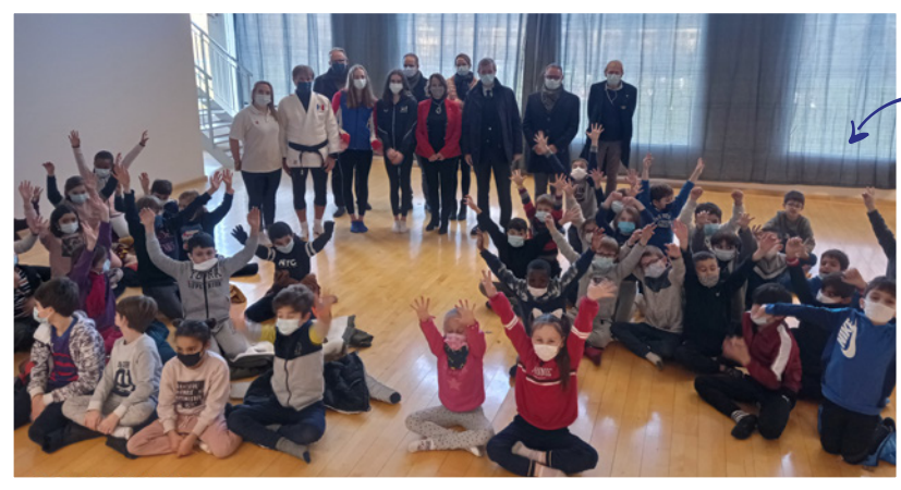
SEMAINE OLYMPIQUE ET PARALYMPIQUE POUR L'ÉCOLE DES NOYERAIES