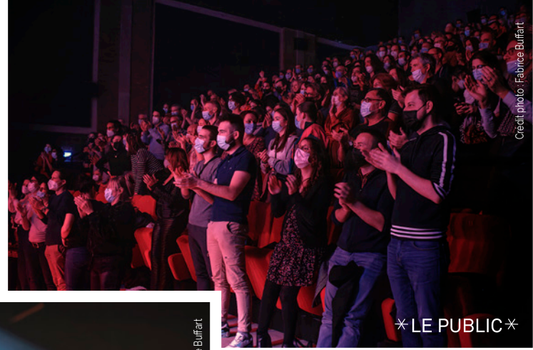
* LE PUBLIC *