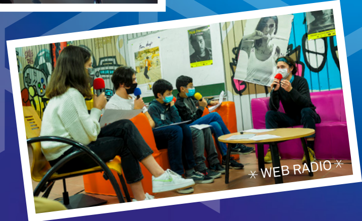
* WEB RADIO *