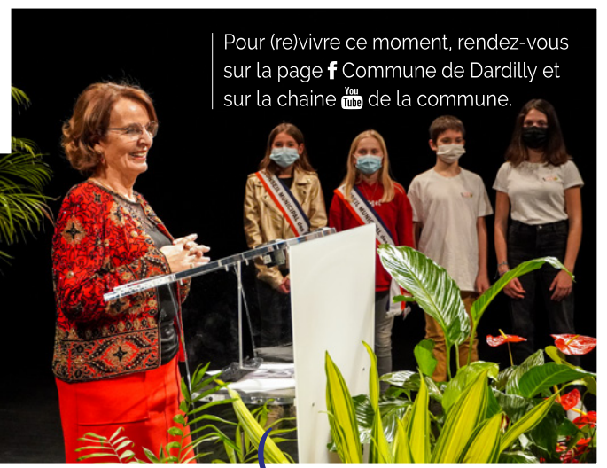
Pour (re)vivre ce moment, rendez-vous sur la page f Commune de Dardilly et sur la chaîne YouTube de la commune.