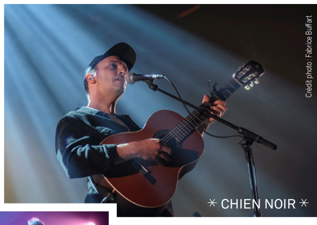
* CHIEN NOIR *